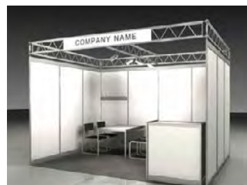
Preis exkl. Fläche: CHF 195.-/m 2