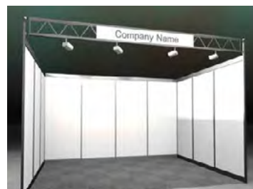
Preis exkl. Fläche: CHF 160.-/m 2