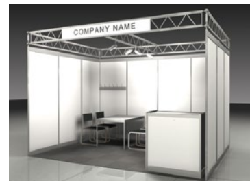
Preis exkl. Fläche: CHF 175.-/m 2